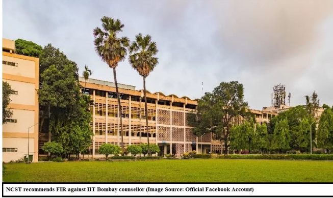
NCST recommends FIR against IIT Bombay counsellor