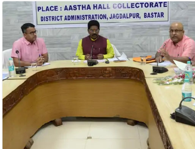
जगदलपुर कलेक्ट्रेट कार्यालय में बैठक हुई।